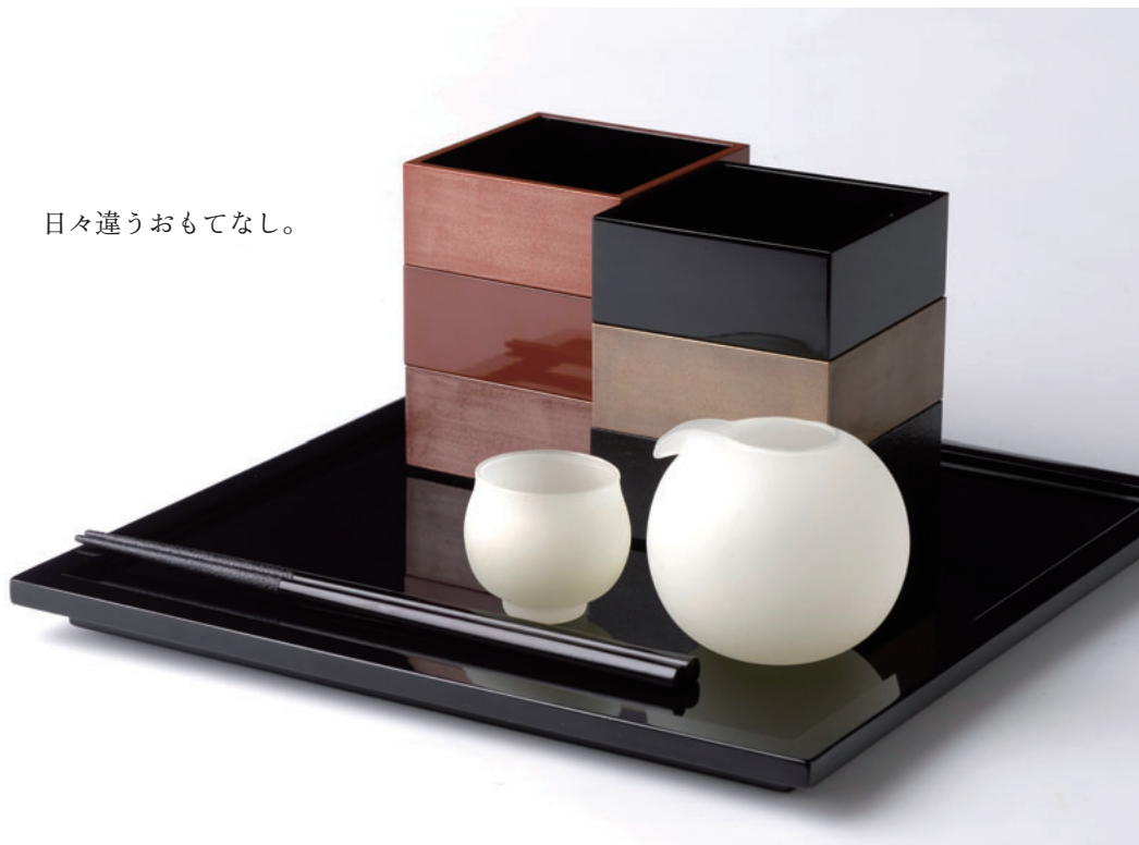
デザイン・ガラス制作/多喜 かおる 制作/木地:駒井 勝利 塗り:源 謙次