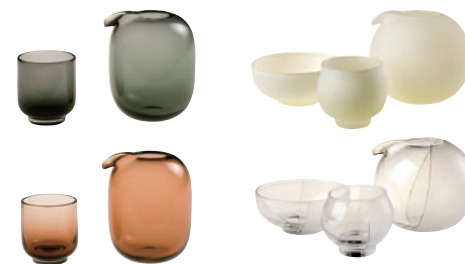
酒器セット01 [グレー]・[茶] 片口/W65×D65×H85mm 杯/W46×D46×H50mm