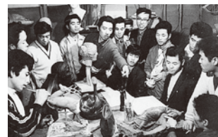
第1期(昭和43年度)の様子