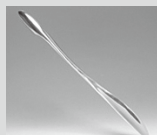
登録番号 2772 AQUARIUM shoehorn (株) 竹中製作所

最新の登録商品は、高岡市デザイン・工芸センター(高岡市オフィスパーク5番)で展示されており、自由に見学することができます。