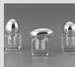
登録番号 3058 ナタリー プチボックス (株) 織田幸銅器