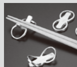
登録番号 2836 箸置き 8(ハチ) (株) 能作