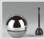
登録番号 2801 仏りん「たまゆら」 (株)本保、(株)小泉製作所