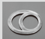
登録番号 2870 栓抜き 日食 (株) 二土