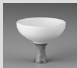
登録番号 2957 Gunomi Sake Cup SHORT HAI (有) 四津川製作所