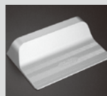
登録番号 3059 C400 ゼッティ (株) 高田製作所