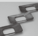
登録番号 2975 鑄鉄製 筆皿 (株) 織田幸銅器