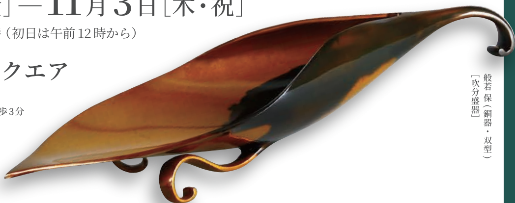
般若保（銅器・双型） 〔吹分盛器〕