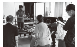
高岡漆器探究コース