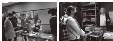
高岡漆器探究1Dayツアー