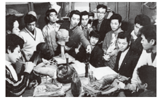
第1期（昭和43年度）の様子