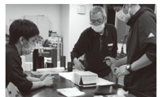
加飾コース、漆工研究コース