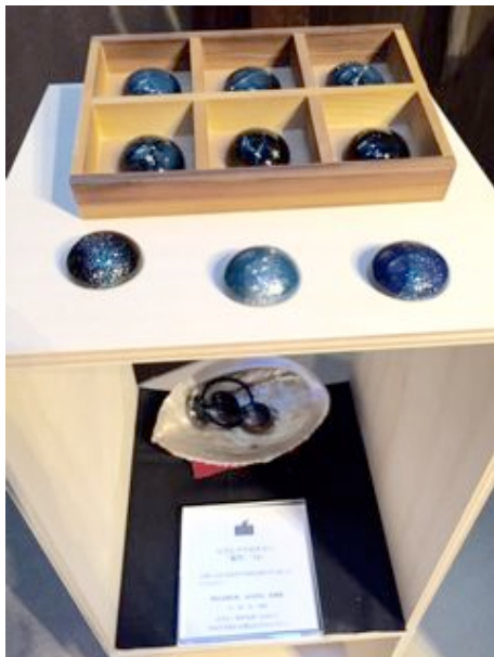
らでんアクセサリー「夜空」「12」