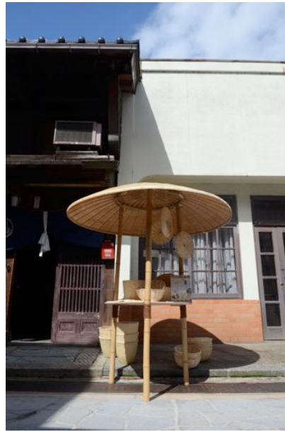
菅かご・菅ざら…大菅笠（直径180cm）の展示台