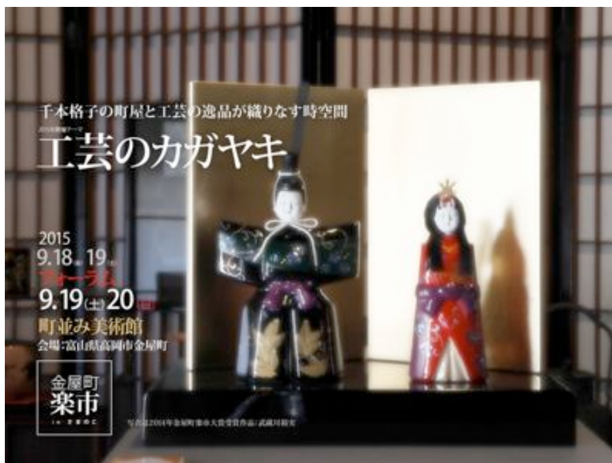
「金屋町楽市」のウェブサイト画像