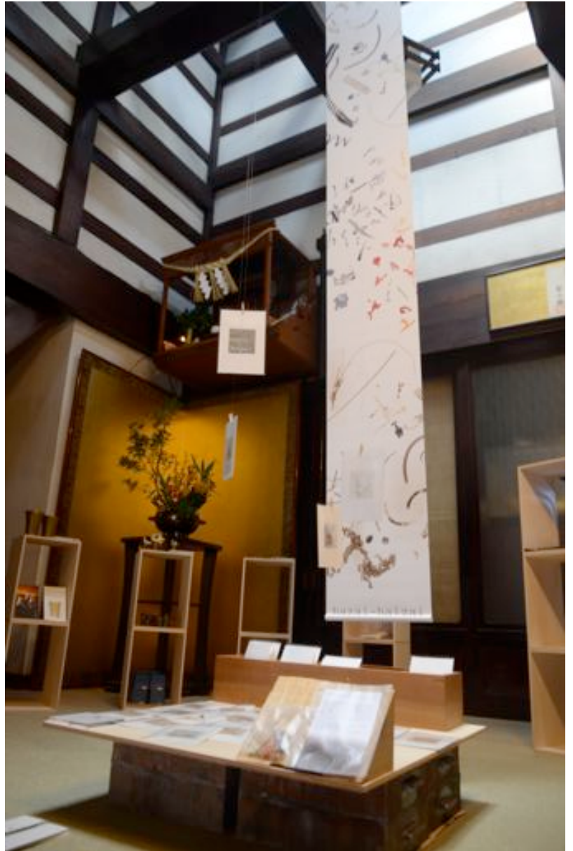
吹き抜きの梁から吊り下げ