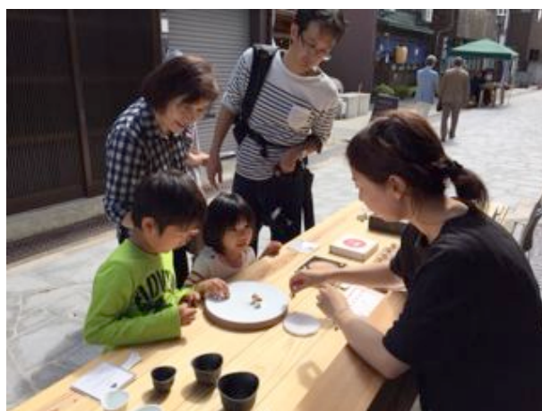
ちりりん独楽…コマ対戦公式土俵で実演