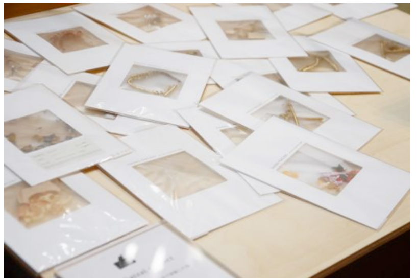
高岡の様々な工場で採集した端材をポストカード大に封入