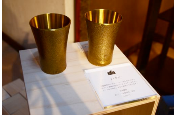
1100° …地金用の廃材“セパ”と合わせて展示