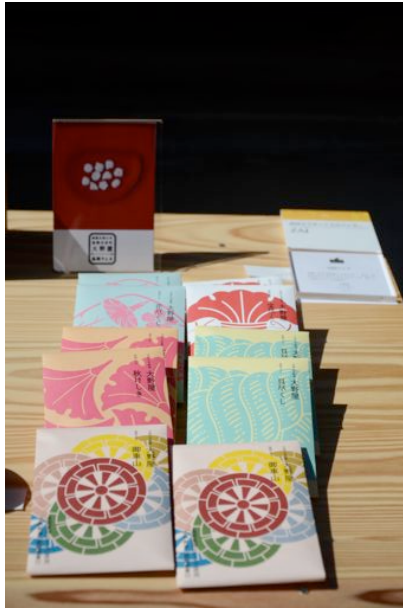
高岡ラムネ…2日目から屋外で展示