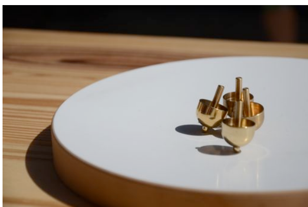
ちりりん独楽…すずしげな音を鳴らしながら回る銅器のコマ