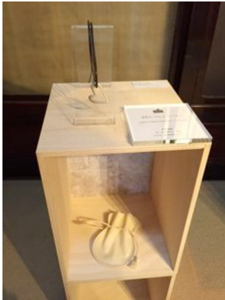
色金ネックレス「ハート」