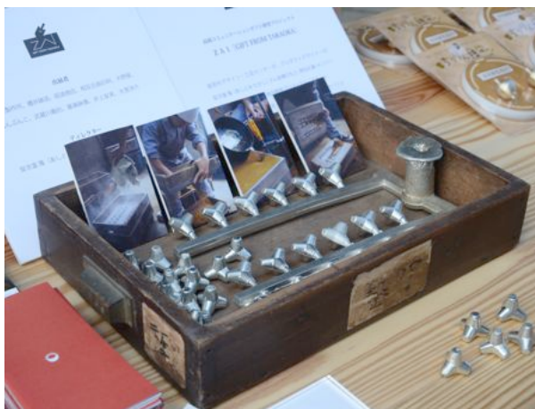
すずテト…製造工程を紹介