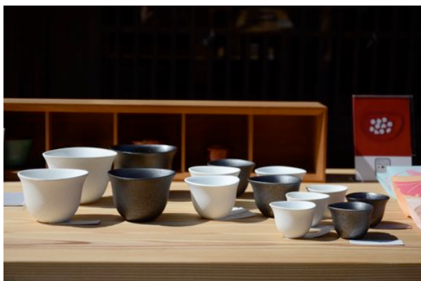
むすび…小・中・大・徳大の4サイズ