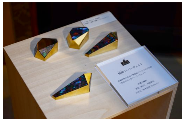
螺鈿ペーパーウェイト