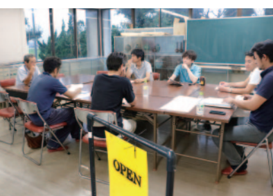
「未来を考える委員会」会議風景

委員会は、団地内の企業に呼びかけ、今まで工場見学すら受けたことのない企業も含めた21社で開催することになった。