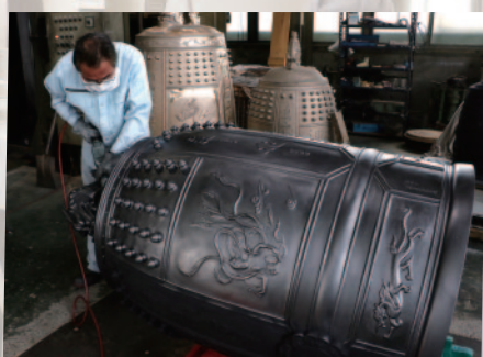
株式会社 老子製作所