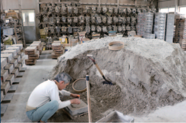
高岡銅器団地オープンファクトリーの風景。(上)瀬尾製作所株式会社(中)株式会社 メタルキャスト(下)水巻銅器製作所